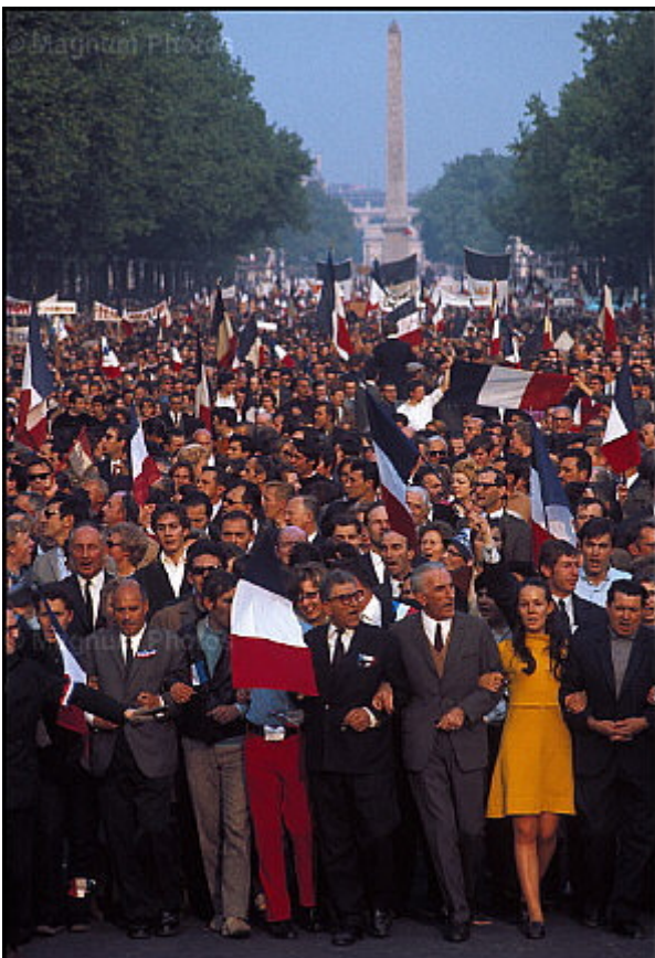
Paris em 1968

Questão 6: As fotos a seguir retratam situações ocorridas em 1968.