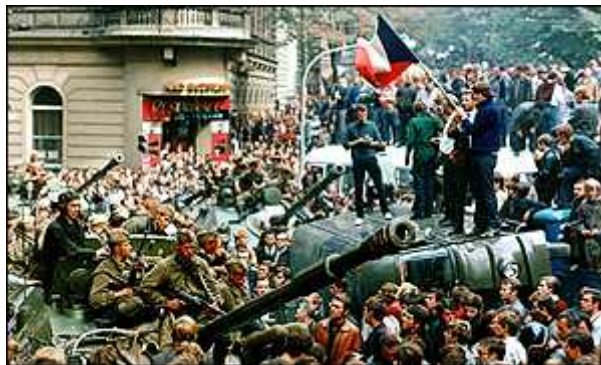
Praga em 1968.

Em 1968 , protestava-se contra tudo, contra todos e em toda parte. Segundo o jornalista Zuenir Ventura, este foi o primeiro movimento do mundo globalizado. Em várias partes do mundo, os jovens foram às ruas, protestar pelas mais diversas razões. Foi também um período em que uma violenta resposta a essas manifestações se fez sentir de forma contundente.